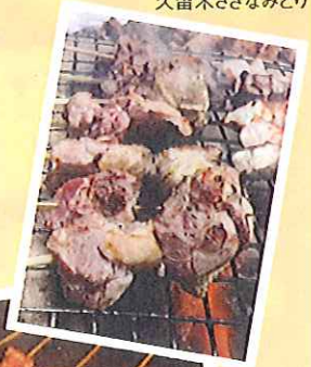
久留米さざなみどり