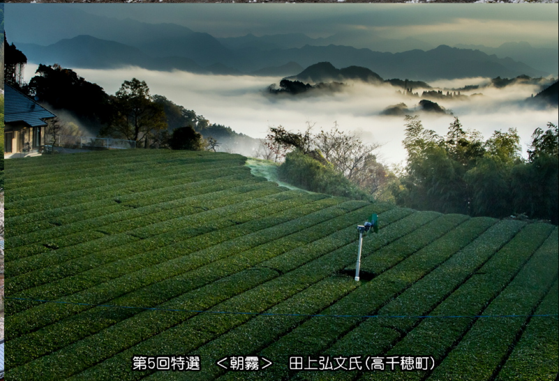
第5回特選 <朝霧> 田上弘文氏(高千穂町)