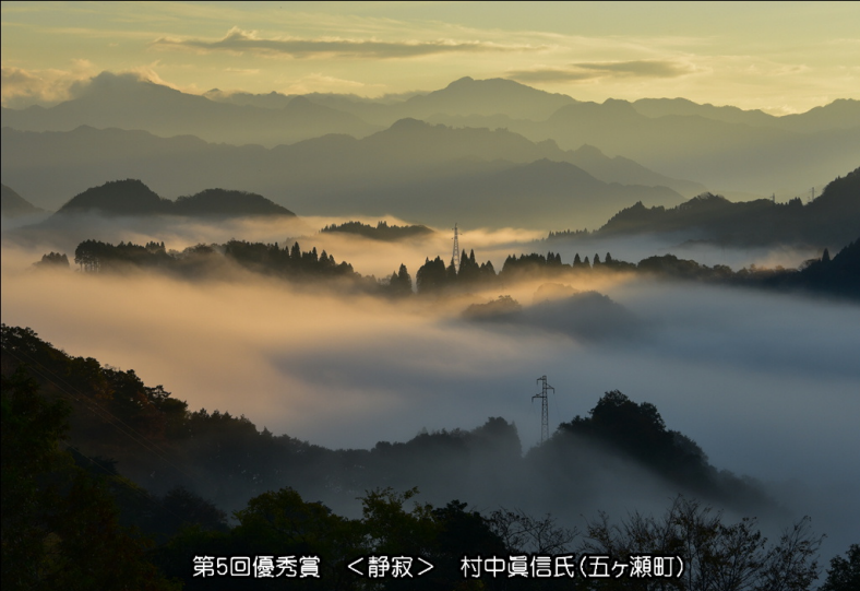
第5回優秀賞 <静寂> 村中眞信氏(五ヶ瀬町)