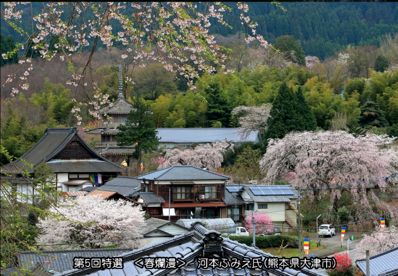
第5回特選 <春爛漫> 河本ふみえ氏(熊本県大津市)