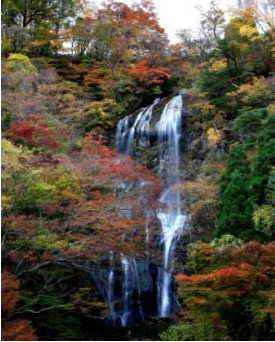
白滝【紅葉見頃 10月下旬～11月初旬】