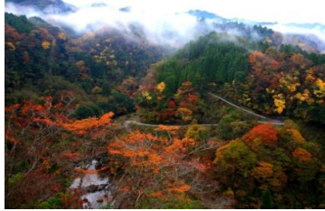
夕日の里大橋 【紅葉見頃 10月下旬～11月上旬】